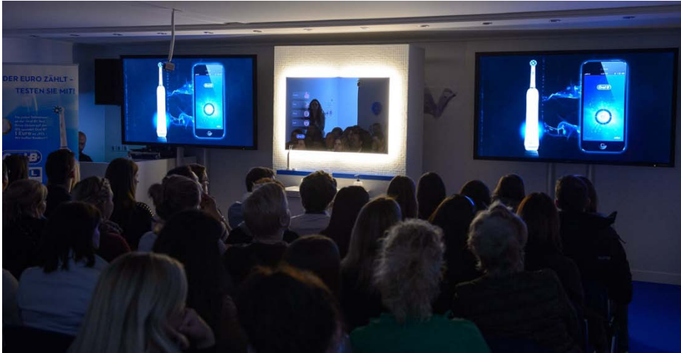
Abb. 7: Im Demo- und Test-Center von Oral-B konnten IDS-Besucher einen Blick auf das Badezimmer von morgen werfen – Oral-B App, Oral-B SmartSeries und Smart Mirror inklusive.