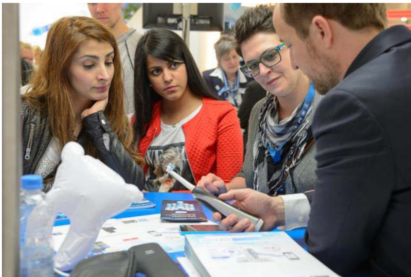
Abb. 10: Am Messestand von Oral-B informierten sich interessierte Besucher über die neuen Möglichkeiten, die sich für Praxis und Patienten aus der Kombination von Oral-B SmartSeries und Oral-B App ergeben.